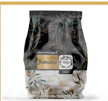
انواع قند و شکر در بسته بندی های 500 گرمی