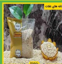
دانه های غلات