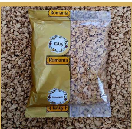
انواع سویا و پروتین های گیاهی در بسته های 150 و 250 گرمی