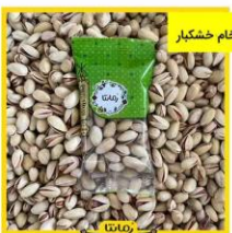
انواع مهرهای خام خشکبار