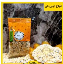
انواع اجل نان