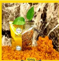
انواع کشمش های پلویی ، سبز و طلایی