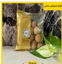
انواع معمولی ساس