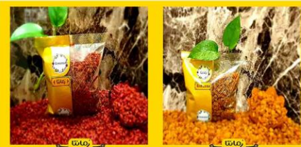
انواع زرشک پفکی و اناری اعلا